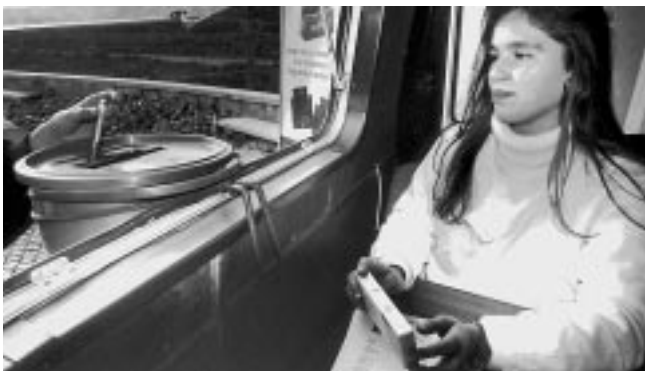
Schadensreduzierung: ein Spritzenaustauschprogramm in Portugal