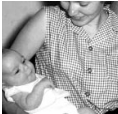
Frauen befürchten, dass sie als „ungeeignete“ Mütter abgestempelt werden und man ihnen ihre Kinder entzieht, falls sie sich in Behandlung begeben.

Drogenabhängige Frauen sind dem Jahresbericht 2000 der EBDD zufolge einer größeren Stigmatisierung ausgesetzt als Männer. Der Bericht betont die Notwendigkeit von spezifischen Drogenhilfemaßnahmen, die auf die Probleme und Bedürfnisse von Frauen zugeschnitten sind.