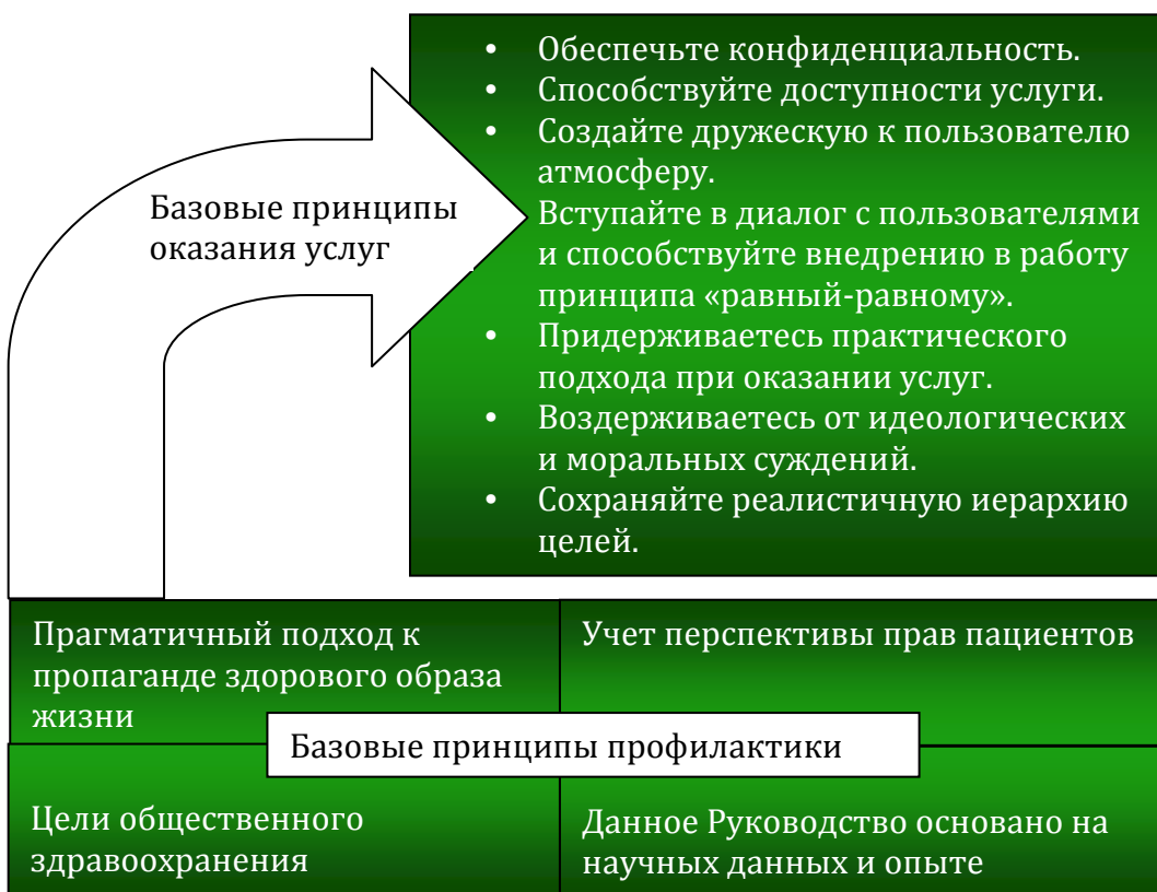
Рис 3: Базовые принципы профилактики инфекций среди потребителей инъекционных наркотиков

В настоящем руководстве базовые принципы представлены двумя разделами: «принципами профилактики» и «принципами предоставления услуг».